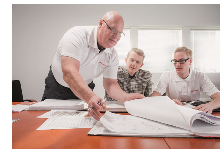
科尼专家现场咨询，提供建议